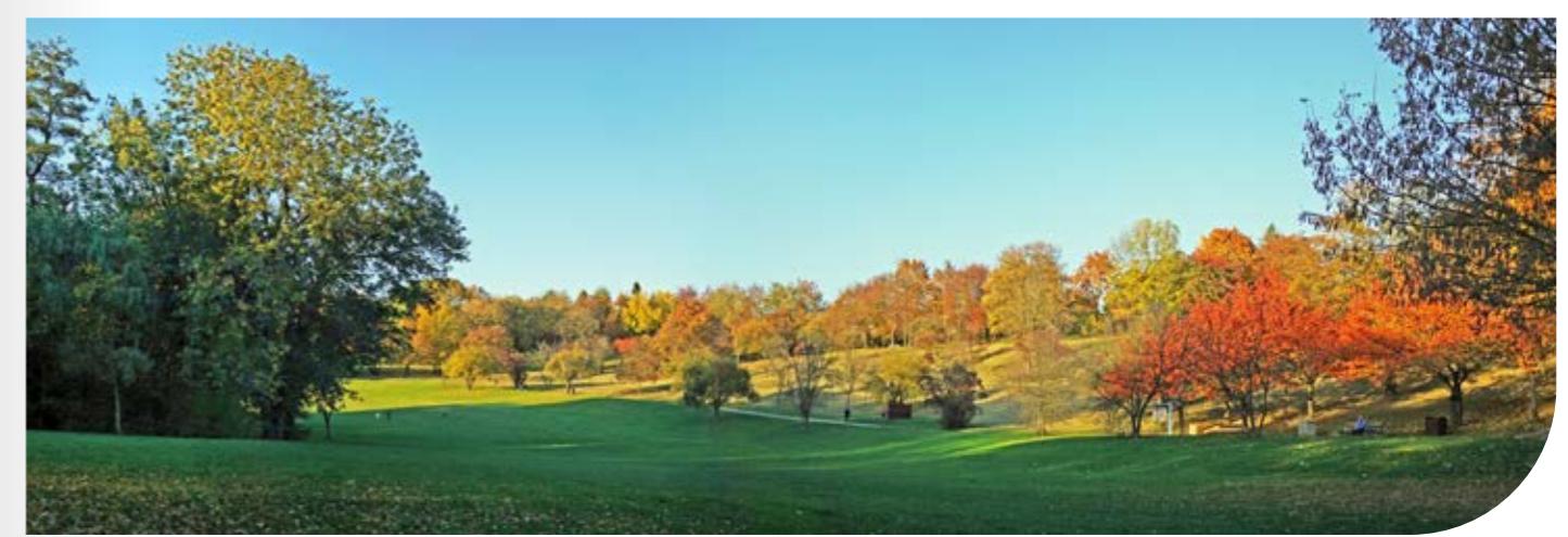
Parc du Morbras

Boulangerie, supermarché, pharmacie... à 450 m, soit 7 min' à pied