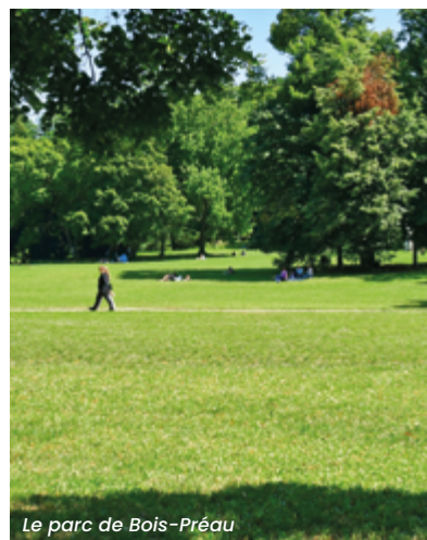
Le parc de Bois-Préau