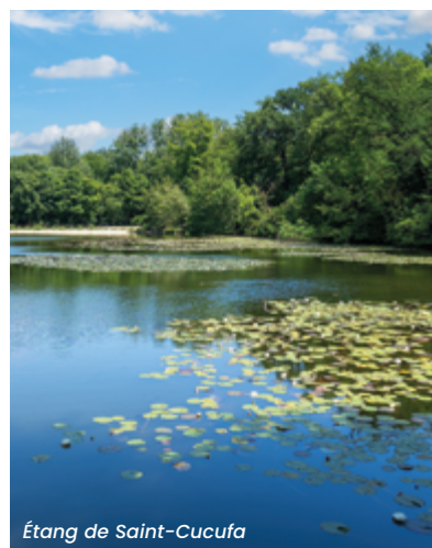
Étang de Saint-Cucufa

À seulement 4 km* de l'Esplanade de La Défense, Rueil-Malmaison est l'une des villes les plus arborées de France. Elle offre 740 hectares d'espaces verts. Des bords de Seine à la forêt domaniale et son château, la ville regorge de lieux magnifiques.