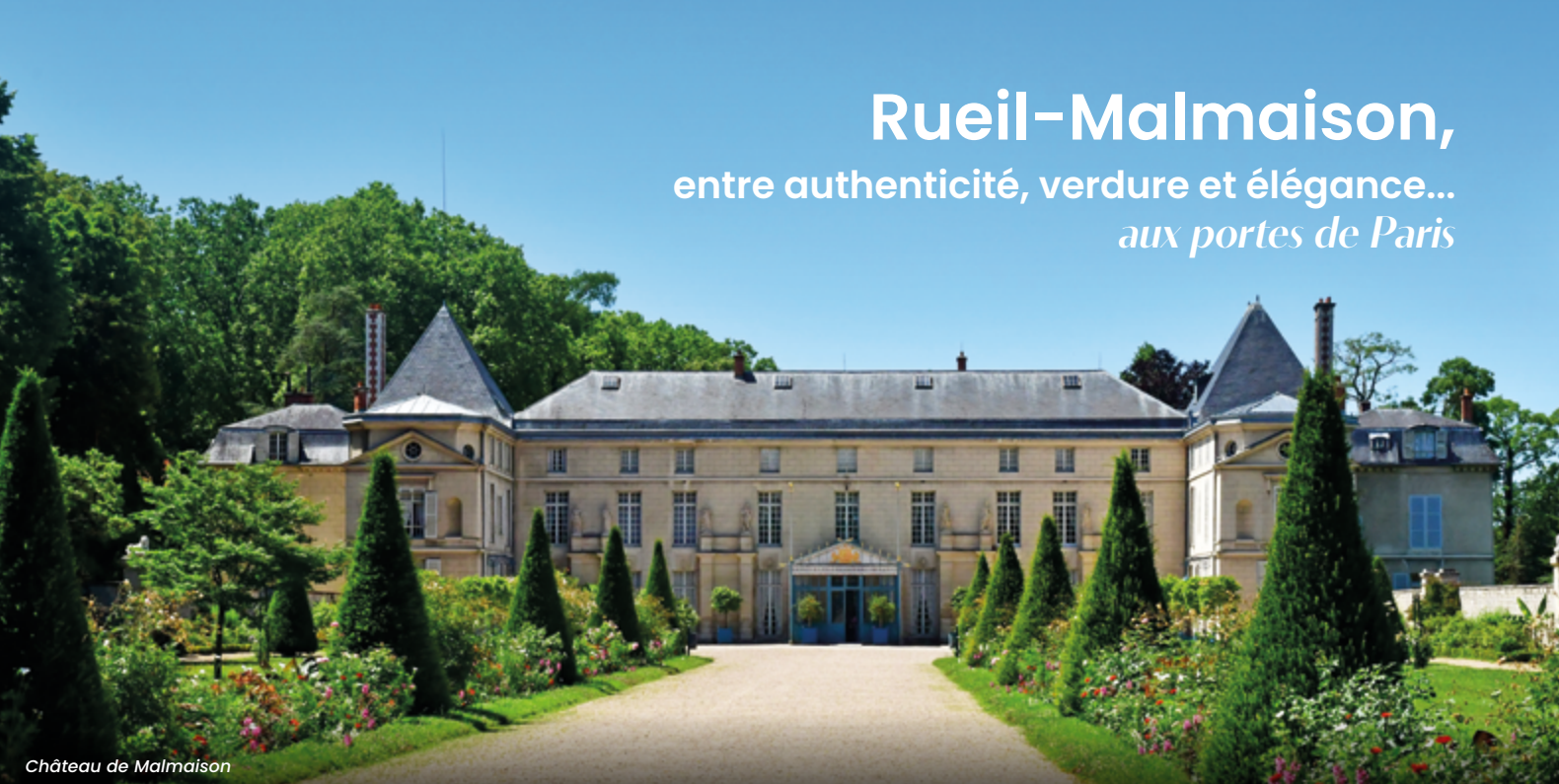
Château de Malmaison