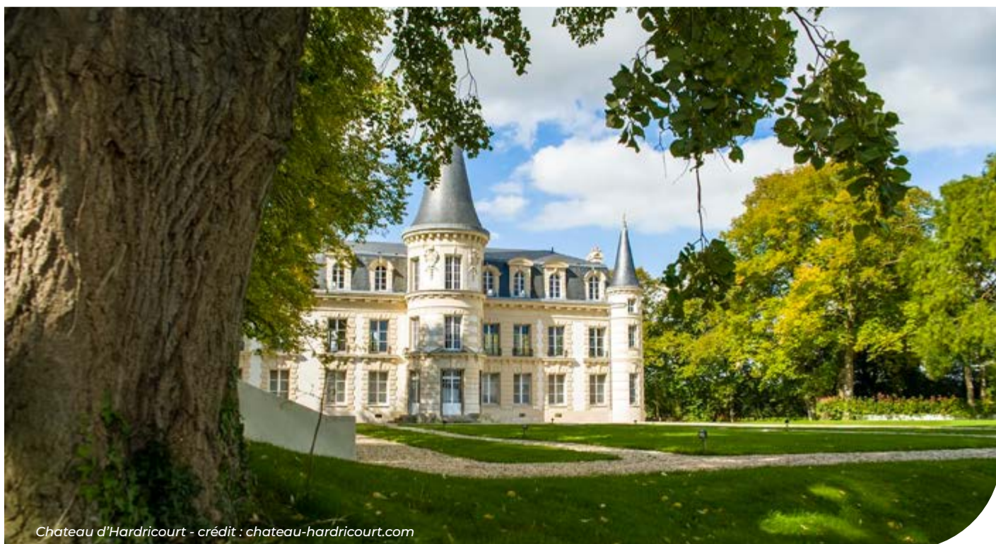
Chateau d'Hardricourt